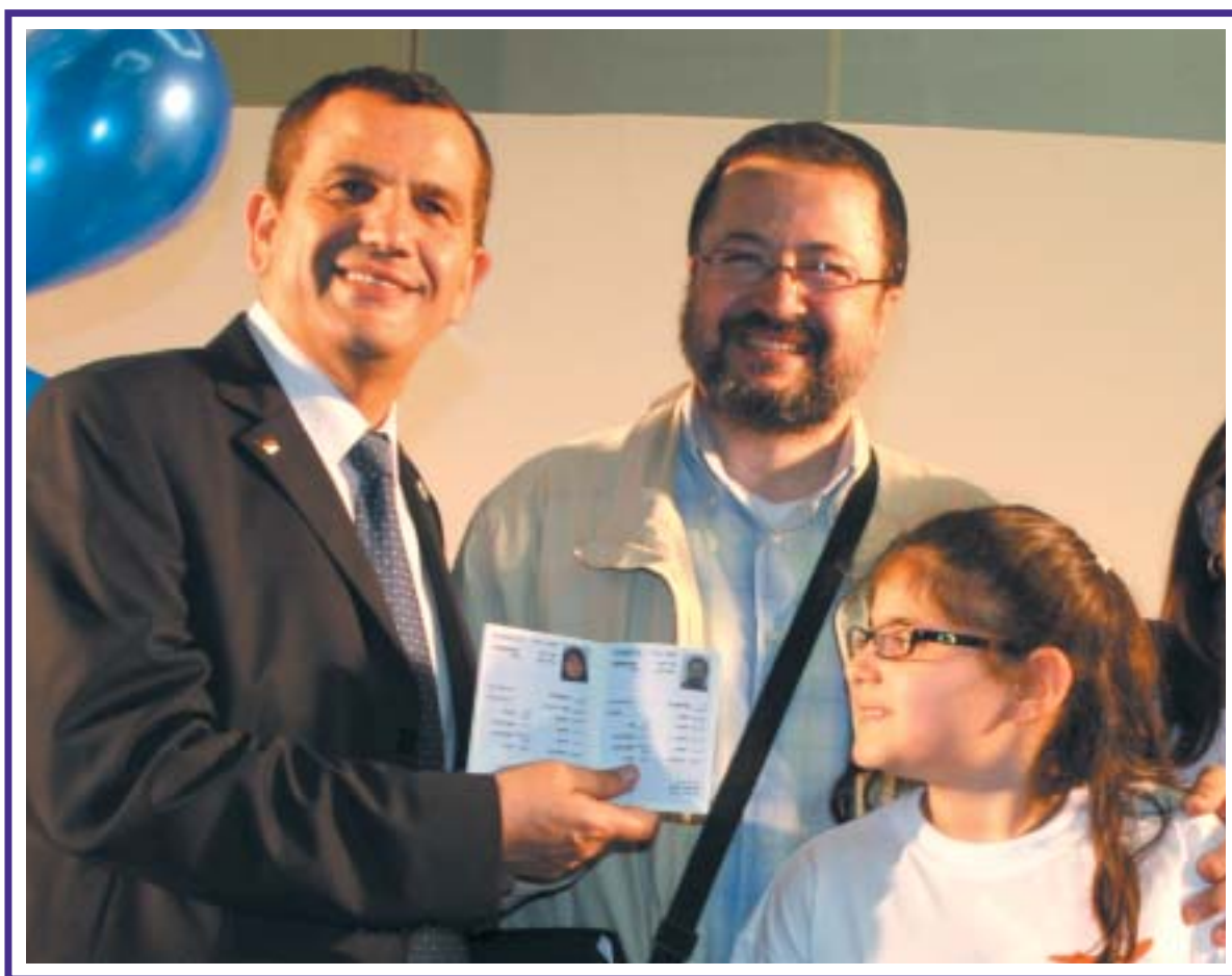
השר לקליטת העלייה יעקב אדרי מעניק "תעודת עולה" למשפחת עולים.